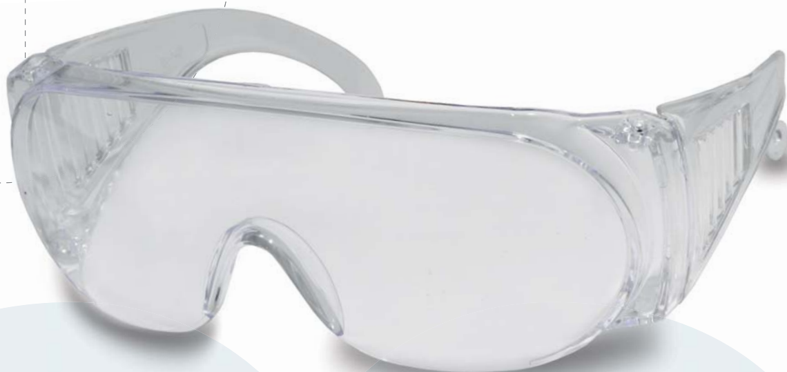
· B92 incolore