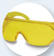
Monolente: ampio campo di visione